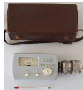
Hidrômetro com termómetro e caixa