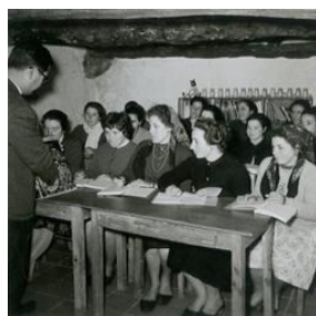
Um técnico do Posto Agrário de Braga dando uma aula sobre agricultura. Foto Artur Pastor, 1966