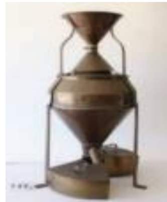
Separador de cereais com dois coletores