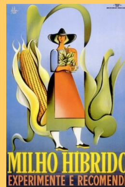
Autor: Abílio. Ministério da Economia. DGSA, 1954