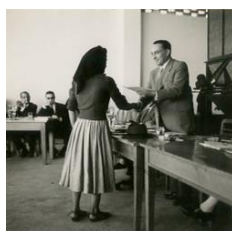
Curso de Arrozeiros, entrega de prémios. Foto Artur Pastor, 1957

Estabeleceram-se secções anexas às Escolas Agrícolas para a instrução agrícola da mulher. Foi o caso da escola prática de agricultura Conde S. Bento, ou da Escola de Pomologia e jardinagem de Queluz. O ensino teórico e os exercícios práticos sobre o conhecimento do solo, criação de pequenos animais, os lacticínios, a produção da seda, a cultura da flor, indústria do linho e da lã, obtenção de mel, fabrico de enchidos,... constituíam uma forma de mitigar e ultrapassar diversos problemas socioeconómicos.