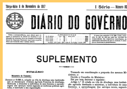
Organização da Colónia Agrícola Feminina de Alcobaça/ Ministério do Fomento e a Direção Geral da Agricultura, 1917

Tendo sido oficialmente reconhecida a necessidade da aprendizagem das mulheres nos serviços rurais, foi criada por Decreto nº 3525-A a Colónia Agrícola Feminina de Alcobaça. Com o objetivo de transmitir as modernas práticas da agricultura, os conhecimentos agrícolas em culturas frutíferas, hortícolas, jardinagem, arvenses, exploração de gado e práticas tecnológicas.