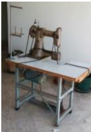
Máquina de costura para os sacos de cereais